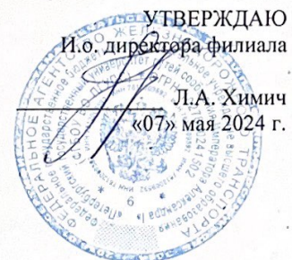
График промежуточной аттестации студентов специальности 23.02.06 Техническая эксплуатация подвижного состава железных дорог на 2-й семестр 2023/2024 учебного года.